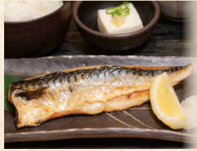
さば定食 set meal: Grilled mackerel 烤鯖魚套餐定食 980円(税込)