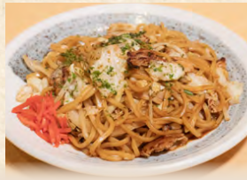
焼きそば stir-fried noodles 日式炒麵 780円(税込)