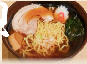
ラーメン Soy source ramen 醤油拉麵 780円(税込)