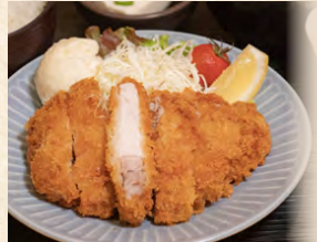
とんかつ定食 set meal: Pork cutlet 豬排定食 1,080円(税込)