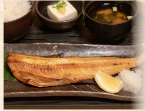
ほっけ定食 set meal: Grilled atka mackerel 青花魚套餐定食 980円(税込)