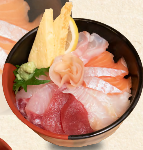
海鮮丼 Sashimi rice bowl 海鮮蓋飯 1,380円(税込)