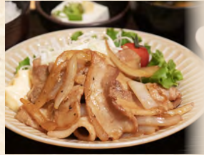
生姜焼き定食 set meal: Ginger pork stir-fry 薑燒豬肉定食 980円(税込)