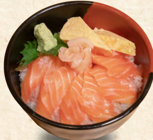
サーモン丼 Salmon bowl 三文魚碗 1,280円(税込)