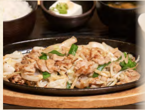
野菜炒め定食 set meal: Vegetable stir fry 豬肉炒蔬菜定食 980円(税込)