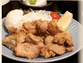
からあげ定食 set meal: Japanese deep fried chicken 炸雞定食 980円(税込)