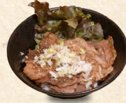
カルビ丼 Kalbi bowl カル比碗 880円(税込) ※自家製プリンは付きません *Homemade pudding not included *不包括自制布丁