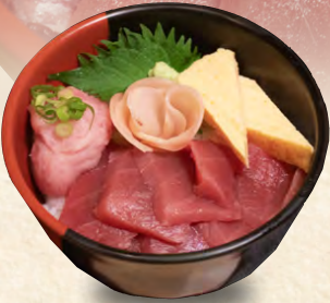
鉄火丼 Sliced tuna bowl 鯖魚蓋飯 1,280円(税込)