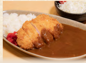
カツカレー Japanese cutlet curry rice with salad 日式咖哩肉排 附沙拉 1,080円(税込)