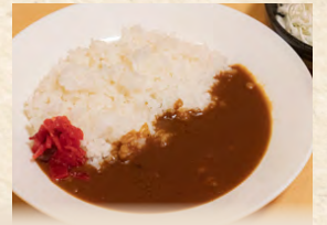
カレー Japanese curry rice with salad 日式咖哩飯 附沙拉 880円(税込)