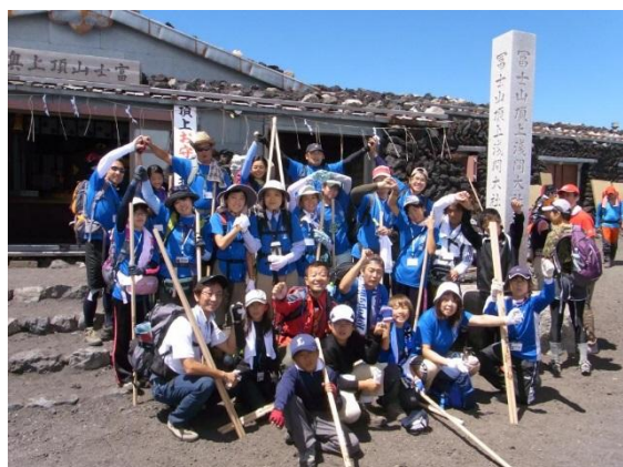
（頂上 久須志神社 富士山頂上浅間大社奥宮前）