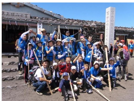
(頂上 久須志神社 富士山頂上浅間大社奥宮前)

Fujiyoshida Roadside Rest & Shopping Area